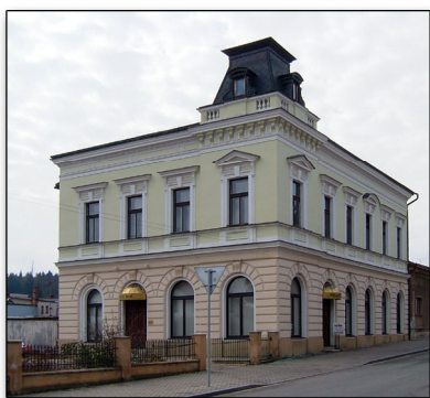
sídlo společnosti VERNER