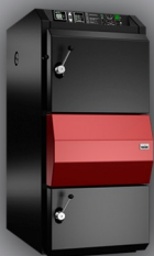
kotle na kusové dřevo